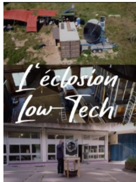
L'Écllosion low tech de L. Biagini, N. Nouhaud et E. Stephan (2022, 76mn)

Dans la région des Grands Lacs, les familles dépendent de l'agriculture. Mais ici, les paysans sont surtout des paysannes, à l'initiative de coopératives. Leur rôle est essentiel pour la vie de la communauté et la réduction de la pauvreté.