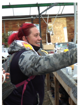
Travailler ensemble, en territoire zéro chômeur longue durée de S. Alphanéry et G. Dreyfus (2022, 50mn)

À «La Fabrique», en Lorraine, la dynamique participative mobilise les acteurs du territoire et implique fortement les salariés, qui tissent des liens privilégiés avec les habitants de la région.