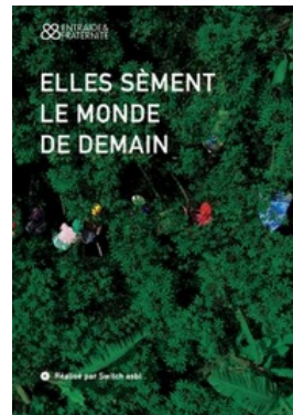
Elles sèment le monde de demain de Switch Asbl (2018, 24mn)

À Somankidi Coura (Sénégal), une coopérative agricole voit le jour dès 1978. Fondée par d'anciens immigrés ayant vécu en France, héritiers de l'esprit de 1968, elle est devenue un modèle dans la région pour celles et ceux qui désirent travailler la terre.